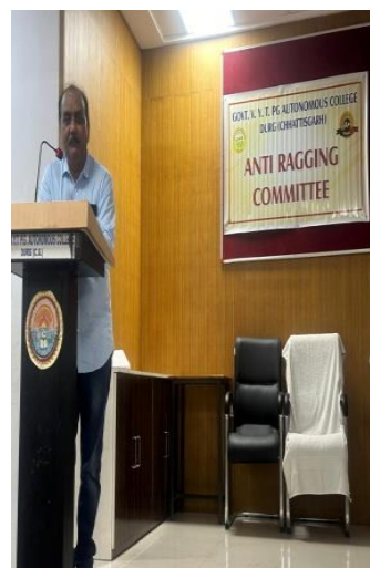
Program conducted for awareness against ragging